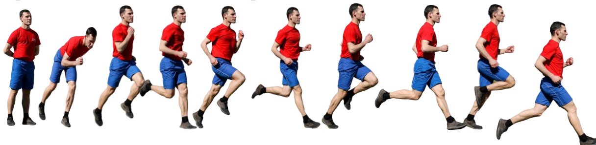
Рис. 7. Бег на 1 км, бег на 3 км.

Старт и финиш, как правило, оборудуются в одном месте. При выполнении упражнений на беговой дорожке стадиона старт и финиш производится в соответствии с разметкой стадиона.